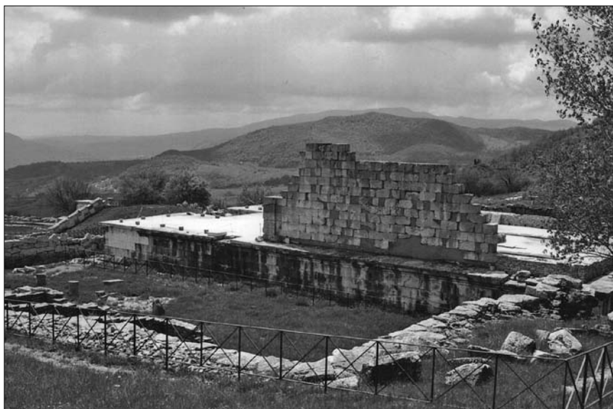
3. Pietrabbondante. Świątynia B – zachowane podium i zrekonstruowany fragment ściany celli.

wano kult w każdej ze świątyń, badacze oznaczyli je konwencjonalnie literami: starszą, mniejszą i wcześniej odkrytą świątynię – literą A, budowlę okazalszą, powstałą w okresie późniejszym i później wydobytą na światło dzienne – literą B. Tym, co wyróżnia okręg sakralny w Pietrabbondante spośród innych miejsc kultu w Samnium, jest usytuowanie dwóch budowli – świątyni B i teatru – w jednym, zaprojektowanym jako całość zespole architektonicznym, którego układ nawiązuje do wzorców stosowanych w innych sanktuariach italskich oraz łatyńskich. Wyjątkowe walory takiego rozwiązania podkreślało malownicze, tarasowe położenie obu budowli – wyżej świątyni, niżej teatru – na łagodnie opadającym stoku, ponad drogą biegnącą u stóp sanktuarium.