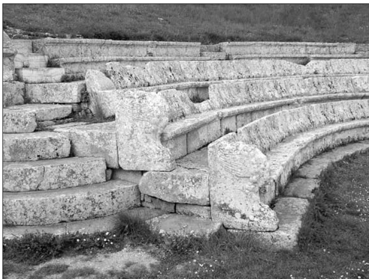
8. Pietrabbondante. Teatr – najniższe rzędy widowni z bocznymi oparciami w kształcie uskrzydłych łap gryfa.