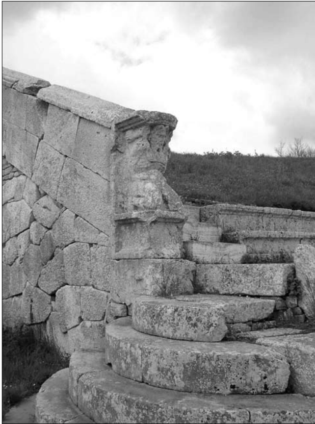
7. Pietrabbondante. Teatr – figura atlasa.

Wielkiej Grecji i Sycylii zaczęły powstawać na obszarze południowej i środkowej Italii wcześniej niż w Lacjum. Ogromne opóźnienie samego Rzymu w tej dziedzinie w stosunku do reszty Italii wynikało stąd, że budowa stałych teatrów została tam w II wieku p.n.e. prawnie zakazana przez senat – jak się zdaje – ze względów przede wszystkim politycznych 43 . Pierwszy kamienny teatr wznosił w Rzymie dopiero Gnejusz Pompejusz Magnus; dedykacja tej budowli miała miejsce w 55 r. p.n.e.