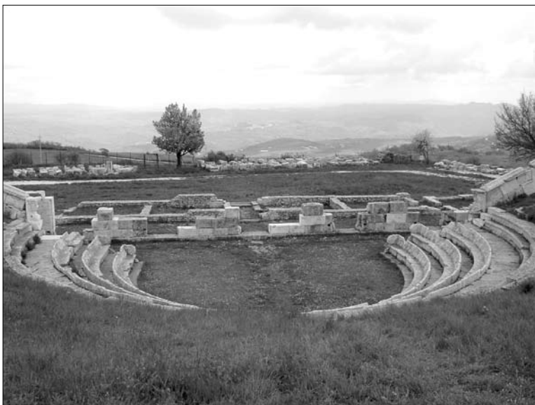
5. Pietrabbondante. Teatr – widok sprzed podium świątyni B.

sojuszników. Pentrowie, zmuszeni przez Rzymian do kapitulacji jak inne plemiona samnickie, przyjęli wówczas status rzymskich sprzymierzeńców.