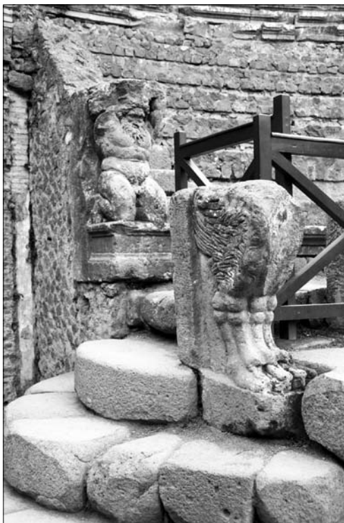
9. Pompeje. Odeon – dekoracje architektoniczne.